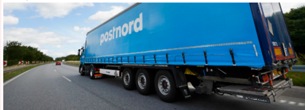
PostNord jobber for å løfte seriositeten i transportbransjen.